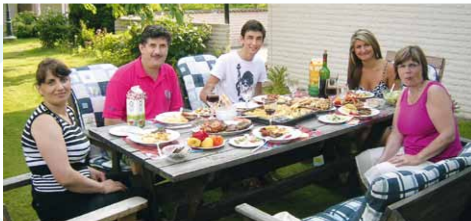
Glede- og gjensynsfest i hagen med Norgesbesøk